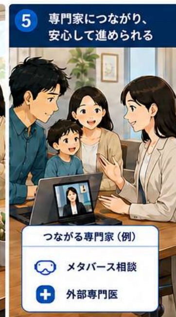
必要に応じて専門家につながり、継続的に支援を受ける