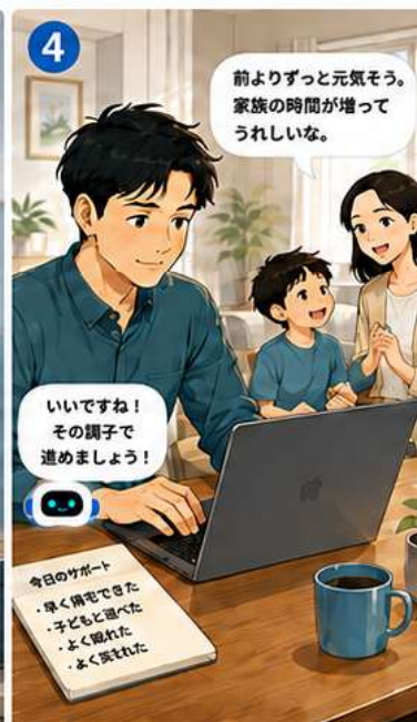
家族で共有し、少しずつ前向きな状態に