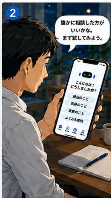
AIに相談して、悩みを言葉にしてみる