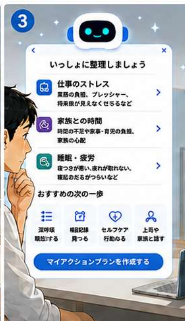
状況を整理し、優先順位と次の一歩を見える化