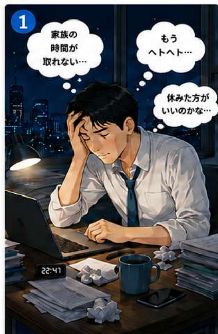
仕事と家庭の両立に悩み、余裕を失っている状態